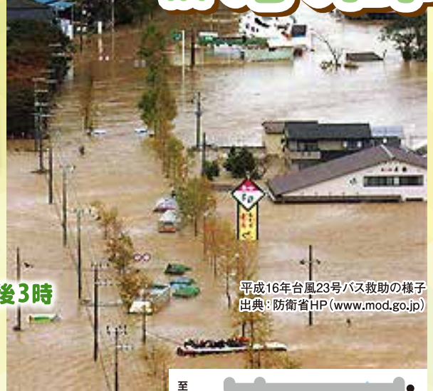
平成16年台風23号バス救助の様子

このキャンプでは、様々な団体のご協力をいただき、地域の避難場所に指定されている公民館での避難所体験や、実際の災害ボランティア活動を学ぶ防災プログラムを取り入れて実施します。