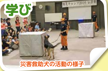
災害救助犬の活動の様子