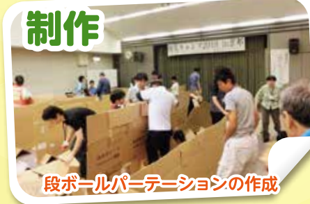
段ボールパーティションの作成