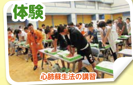
心肺蘇生法の講習